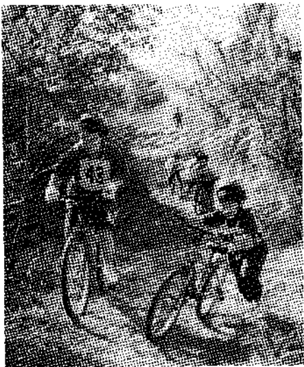
▲ジュニア・マウンテンバイクフェスティバルでのレースの1コマ。上り坂では、マウンテンバイクから降りて押して上がる子どもも続出。乗ったままか、降りて押すのか、どちらが速く上りきれるのかな？

協議会では年3回の教室と、1回の大会を開催していますが、複数回参加していて、内容に物足りなさを感じはじめた子ども達のた